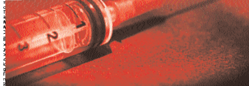
Tabella di documentazione delle morti da rock'n'roll degli ultimi vent'anni