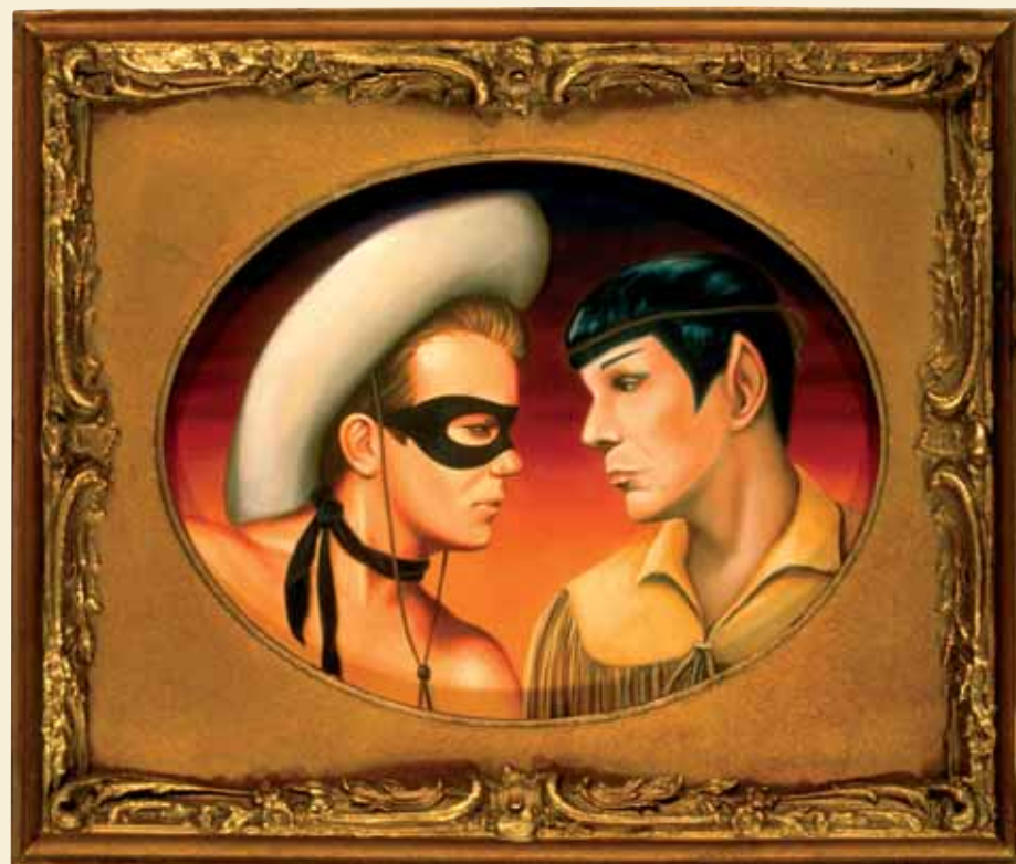
Besame Mucho, 2003 - Oil on wood, 10 x 12 inches

creating my own histories for them, which led to using them as characters to re-tell old stories from classical mythology and the bible. Common themes are unrequited love, forbidden romance, secret passions and fleeting moments of bliss.