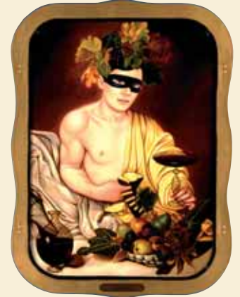
Frank and Mia, 1996 - Acrylic and enamel on tin TV tray, 20 1/2 x 16 3/4 inches Assumption of Elvis, 1991 - Acrylic and enamel on tin TV tray, 15 3/4 x 20 3/4 inches Bacchus Boy Wonder, 1999 - Acrylic and enamel on tin, 22 x 16 inches

I baffi di Dalì incollati su di una serigrafia di Warhol. Da queste parti il concetto di Surrealismo Pop non è ancora ben chiaro. Ce lo spieghi una volta per tutte dandoci una tua definizione?