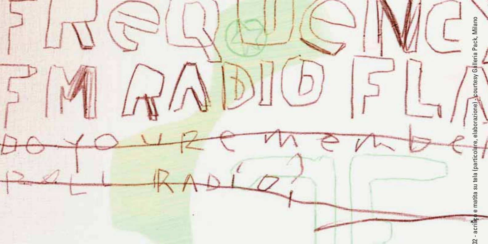
Bartolomeo Migliore: SONICS, 2002 - acrilico e matita su tela (particolare, elaborazione)

OK allora stai guidando, e ovviamente ascoltando la radio. In questo tratto di percorso le emittenti si sovrappongono. Un ritornello dei Ramones si confonde con una strofa dei Pixies, e quando meno te l'aspetti in questo zapping radiofonico spontaneo si inseriscono i versi dei Killing Joke, proprio quel pezzo che non sentivi da un sacco e ti faceva credere che gli anni '80 fossero una figata. Prestando attenzione a questi frammenti di testo, li colleghi tra loro in una sorta di cut-up Burroughsiano, e il senso attribuito alla canzone così costruita ti fa immaginare che qualche entità superiore stia cercando di comunicare con te. Forse Dio, o Gli Alieni, comunque ce l'hanno proprio con te. WOW! Non male, ma il meglio (il Migliore?) deve ancora arrivare. E infatti entri in città, e allo zapping radiofonico si sovrappone quello ambientale. I muri ti parlano, anche loro ce l'hanno con te. Riconosci brandelli dei versi che stai ascoltando nelle frasi spruzzate sugli edifici, e i caratteri tipografici ti rapiscono trascinandoti nei manifesti, nei cartelloni, dentro gli adesivi appiccicati al semaforo. E allora ti accorgi che più emittenti si stanno mescolando, e trasmettono T-Rex, Clash, Queens Of The Stone Age, e altri ancora che non conoscevi... Do you remember rock'n'roll radio? OK, eccoti dentro la pittura di BARTOLOMEO MIGLIORE .