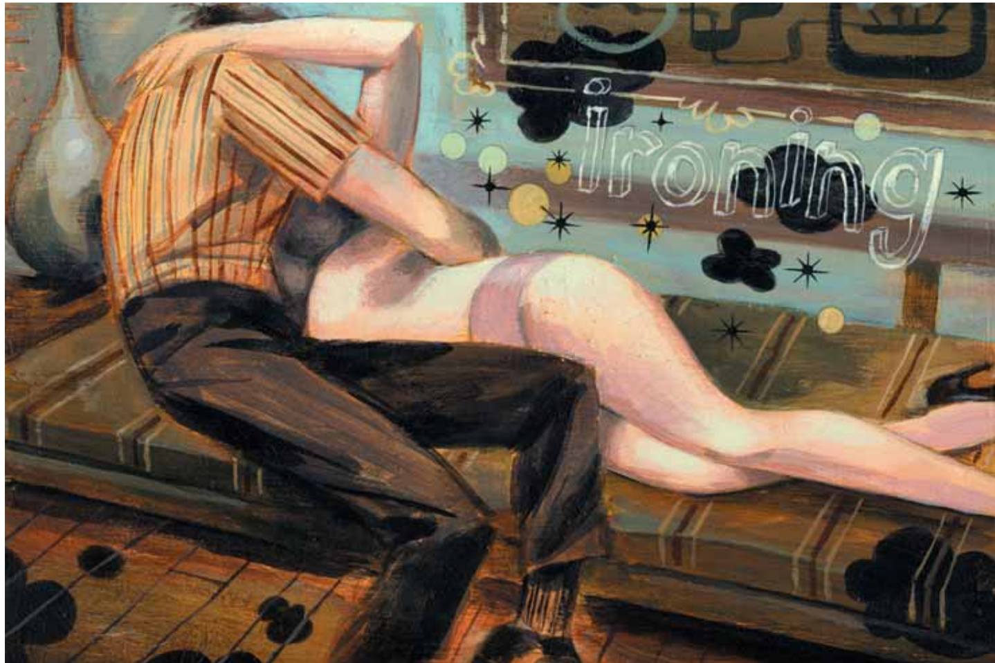
Ironing, acrylic on board

Here in Torino we feel somehow connected with Detroit. We have a common history of "rise and fall" of the motor city dream and a particular bent for genuine rock'n'roll. Tell us about today's Detroit scene.