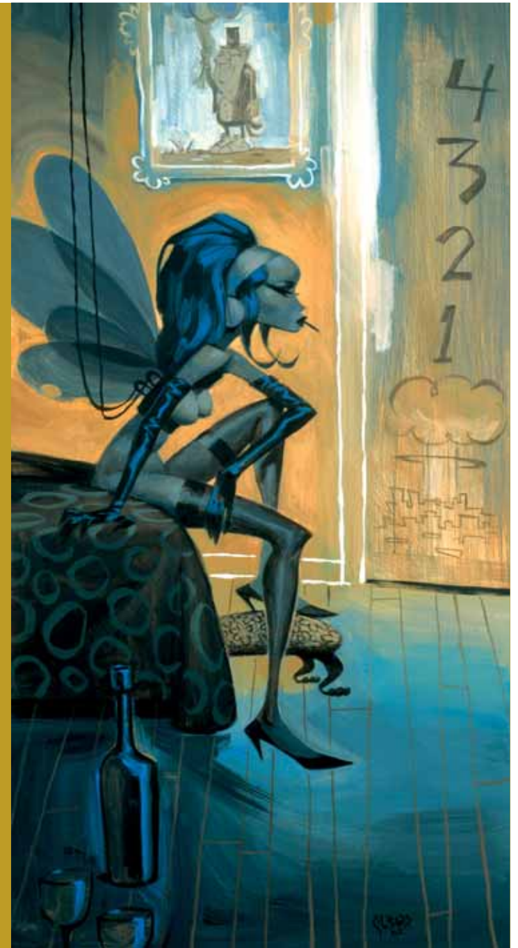
Suspension, acrylic on masonite