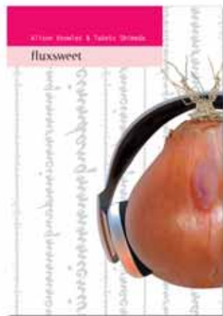
Cover of the CD/DVD "Fluxsweet", including among others the "Nivea Cream", "Finger Exercise" and "Onion Skin Song" performances, out soon on Rossbin Records ( www.rossbinrecords.com )

WHEN I STUDIED IN ART SCHOOL I PAINTED ABSTRACT PAINTINGS UNDER SOME VERY WELL KNOWN ARTISTS LIKE GOTTLIEB AND KLINE. I HAD A SHOW OF SUCH WORKS AT THE NINEGON GALLERY IN 1958. VERY SOON AFTER THIS EXHIBITION OF VERY LARGE COLORFUL WORKS, I DECIDED TO DESTROY THEM ALL AND DID SO BY FIRE OUT IN THE COUNTRY AT MY FATHERS HOUSE. I NOW WISH I HAD A FEW BECAUSE I COULD SURELY SELL THEM NOW IN ITALY. IT WAS AN IMPORTANT THING TO DO BECAUSE I TURNED TO PERFORMANCE, TO INSTALLATION AND TO SOUNDART. AT THAT TIME ALL THIS COULD BE EXPRESSED FOR ME IN THE FLUXUS GROUP AND I JOINED IN AND STARTED TRAVELING. THE DECISION WAS THAT I AM NOT AN ABSTRACT ARTIST, AND AT THIS TIME EVERYTHING IN THE NEW YORK ART SCENE PROMOTED ABSTRACT ART, ABSTRACT EXPRESSIONISM AND TWO DIMENSIONAL MUSEUM WORKS.