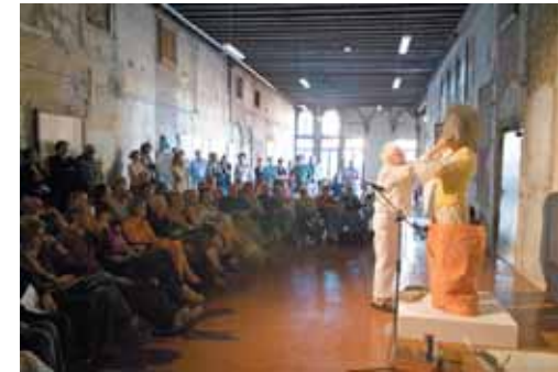
"Loose Pages" performance at the Museo Fortuny in Venice.

ULTIMAMENTE LAVORO CON OGGETTI AVVOLTI IN CARTA BAGNATA PREPARATA DA ME CHE POI PRESENTO ALLE MOSTRE CON UNA PICCOLA ETICHETTA ATTACCATA SOPRA CHE DICE "DONATE IL VOSTRO FIGLIO PER LA GUERRA, È UN BUON BUSINESS", OPPURE UNA ANCORA PIÙ POLITICA COME "È NELLA FORZA DELLE PERSONE RIMUOVERE UN GOVERNO AL POTERE". GLI OGGETTI DIETRO QUESTE ETICHETTE RARAMENTE HANNO UNA CONNESSIONE CON IL MESSAGGIO. QUESTI OGGETTI (UN TAPPO DI LAVANDINO, O DUE PARTI DI SCARPE LEGATE INSIEME)